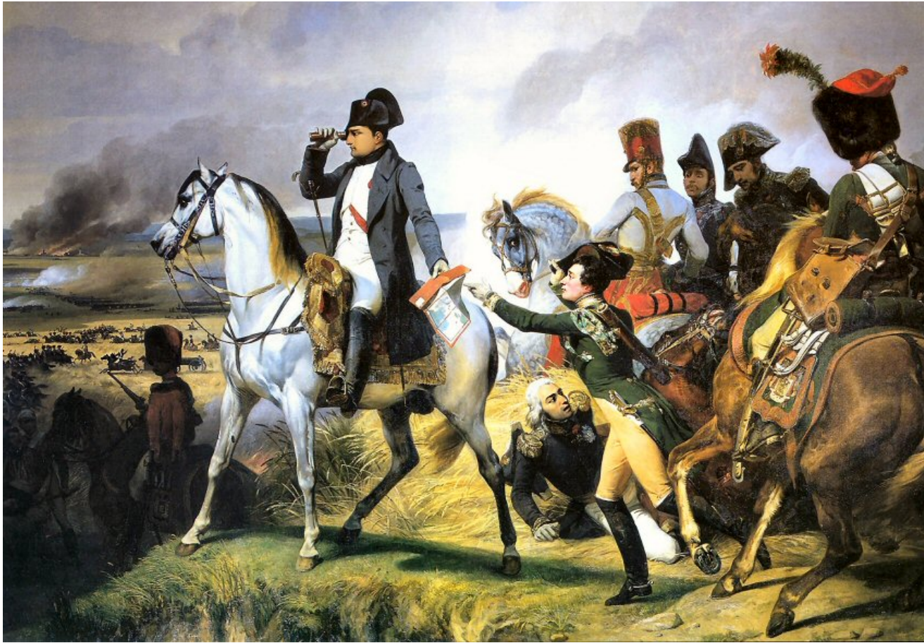
Horace Vernet (1789-1863), Bataille de Wagram, 6 juillet 1809 , 1835, Salon de 1835, huile sur toile, 465 x 543 cm, Versailles, musée national des Châteaux de Versailles et de Trianon