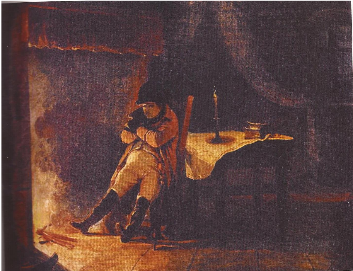
Charlet (1792-1845), Le soir de la bataille de Champaubert , 1814, Paris, Musée de Légion d'honneur