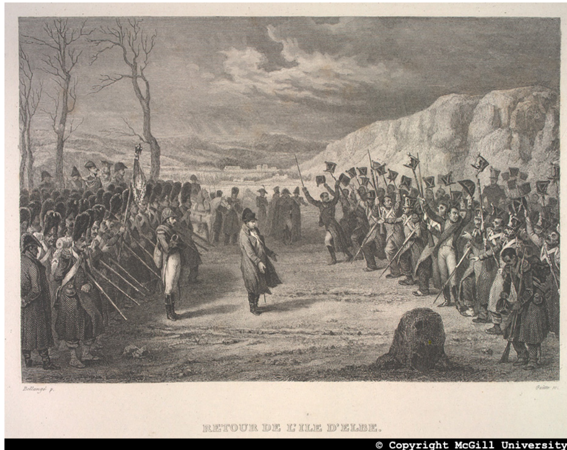
Hippolyte Bellangé (1800-1866), Napoléon au retour de l'île d'Elbe , Salon de 1834, lithographie, Bibliothèque Nationale de France