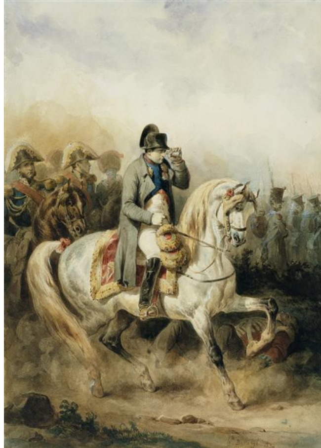
Hippolyte Bellangé (1800-1866), Napoléon sur son cheval gris , 1839, aquarelle gouachée et crayon, 40 x 28,5 cm, Londres, Wallace Collection