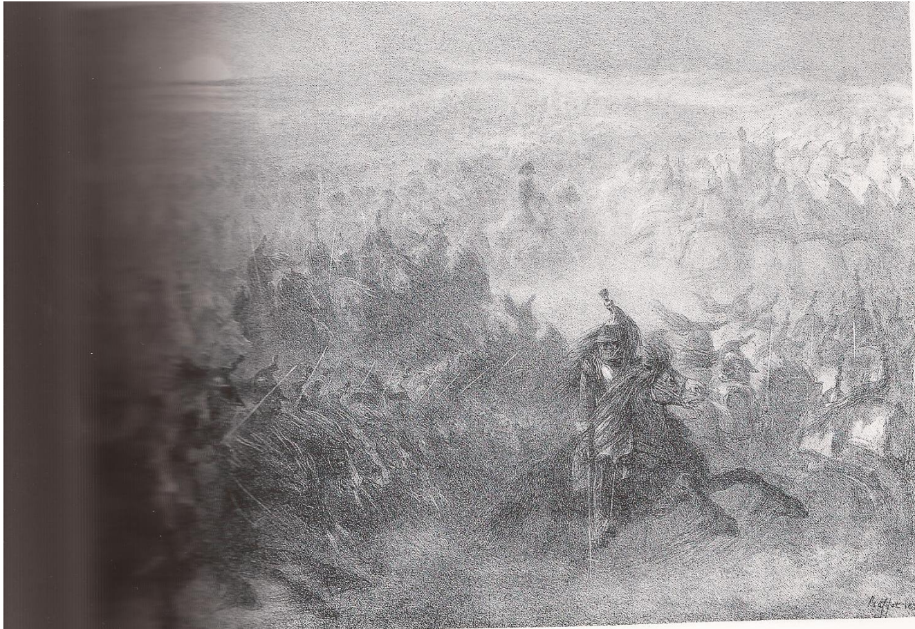
Auguste, Raffet, (1804-1860), La Revue Nocturne , lithographie, Paris, Bibliothèque Nationale de France